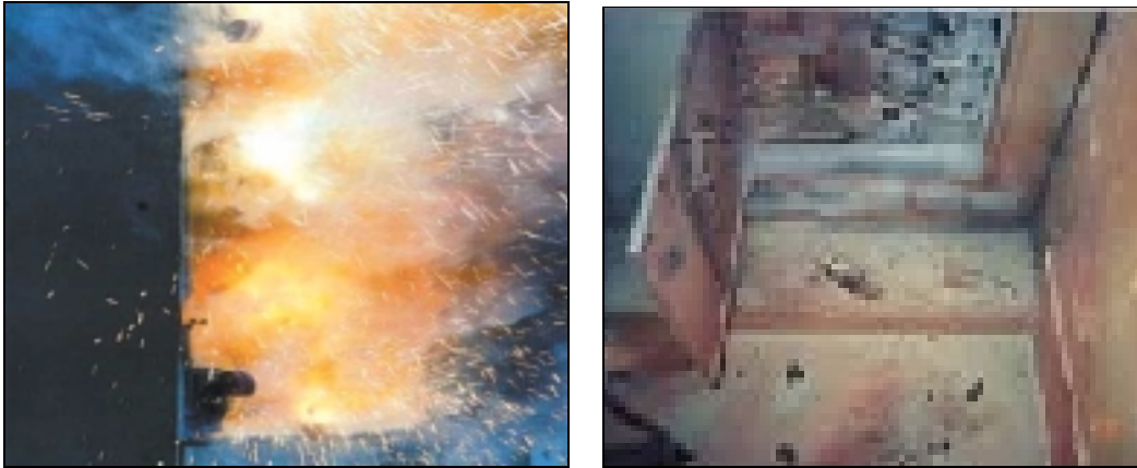
Figura No.2. Arc Flash en panel. 3

Ejemplos de eventos de Arc Flash ocurridos en un panel directamente frente a un trabajador. Este sufrió quemaduras de tercer grado, quemándole el 28 % del cuerpo. Teniendo significantes pérdidas de la vista, del oído y del olfato.