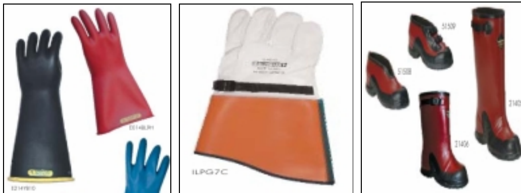
Figura No. 6. Guantes y Botas de Protección