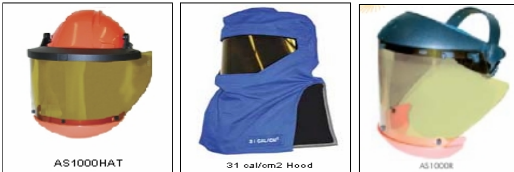
Figura No. 5. Cascos