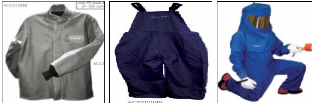
Figura No. 4 Ropa resistente a la Flama. (a) Chamarra; (b) Overall; (c) Traje completo.