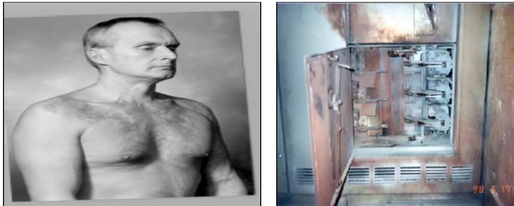
Figura No.3. 4

Ejemplos de eventos de Arc Flash ocurridos en un panel directamente frente a un trabajador. Este sufrió quemaduras de tercer grado, quemándole el 28 % del cuerpo. Teniendo significantes pérdidas de la vista, del oído y del olfato.